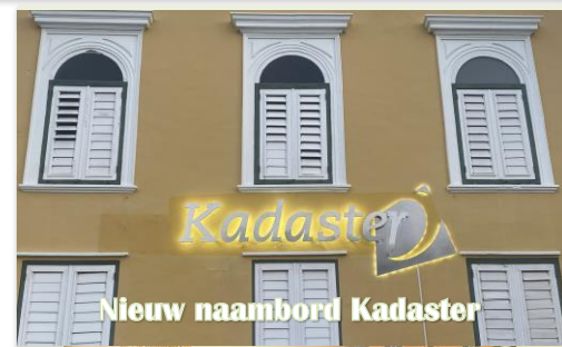
Nieuw naambord Kadaster