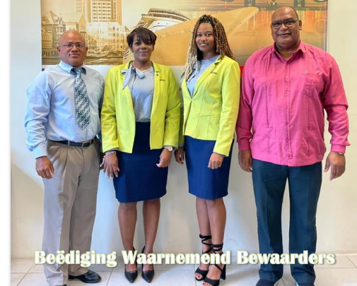
Beëdiging Waarnemend Bewaarders