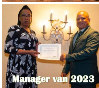
Manager van 2023