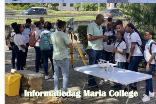
Informatiedag Maria College